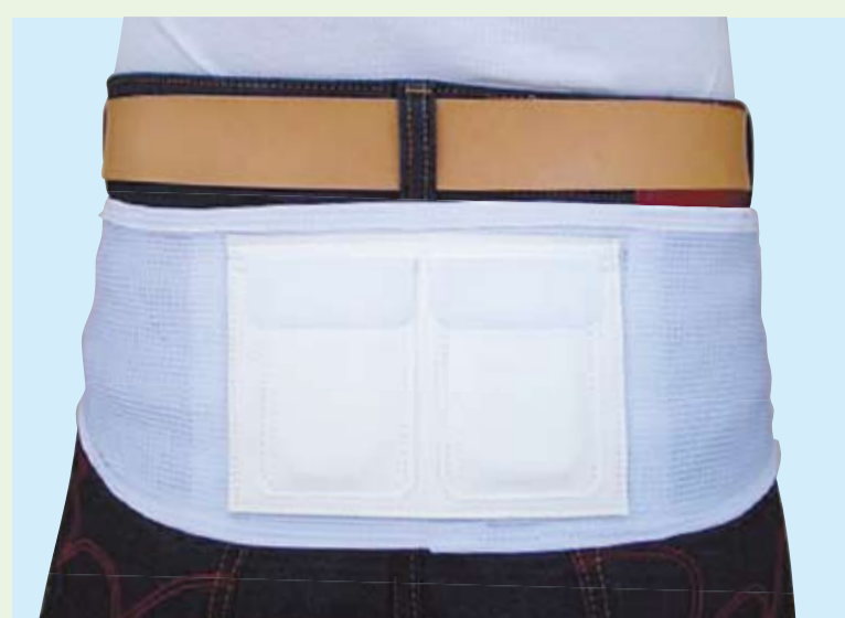
夏用 (メッシュタイプ)